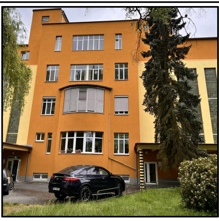
ZUBNÍ KLINIKA V NEMOCNICI CHEB